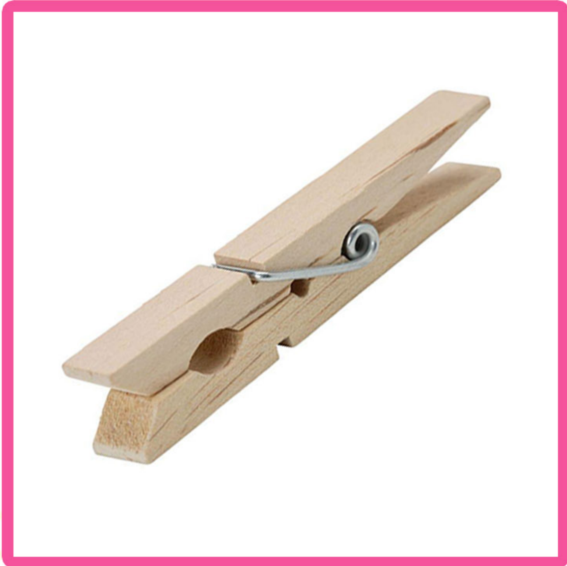
Drewniany wieszak na ubrania