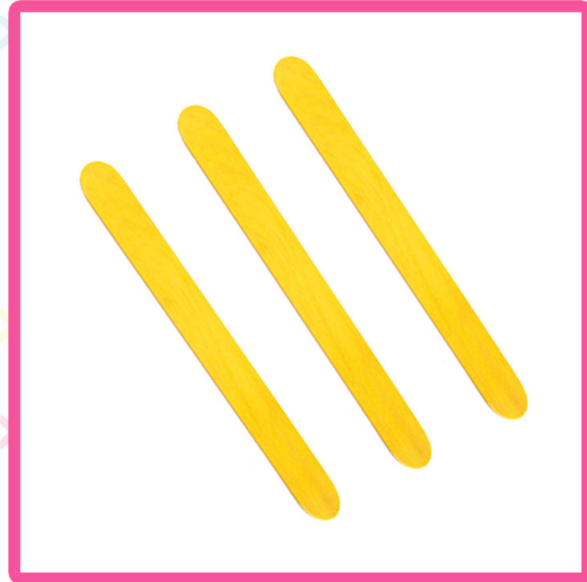
Kolorowy patyczek od lizaka