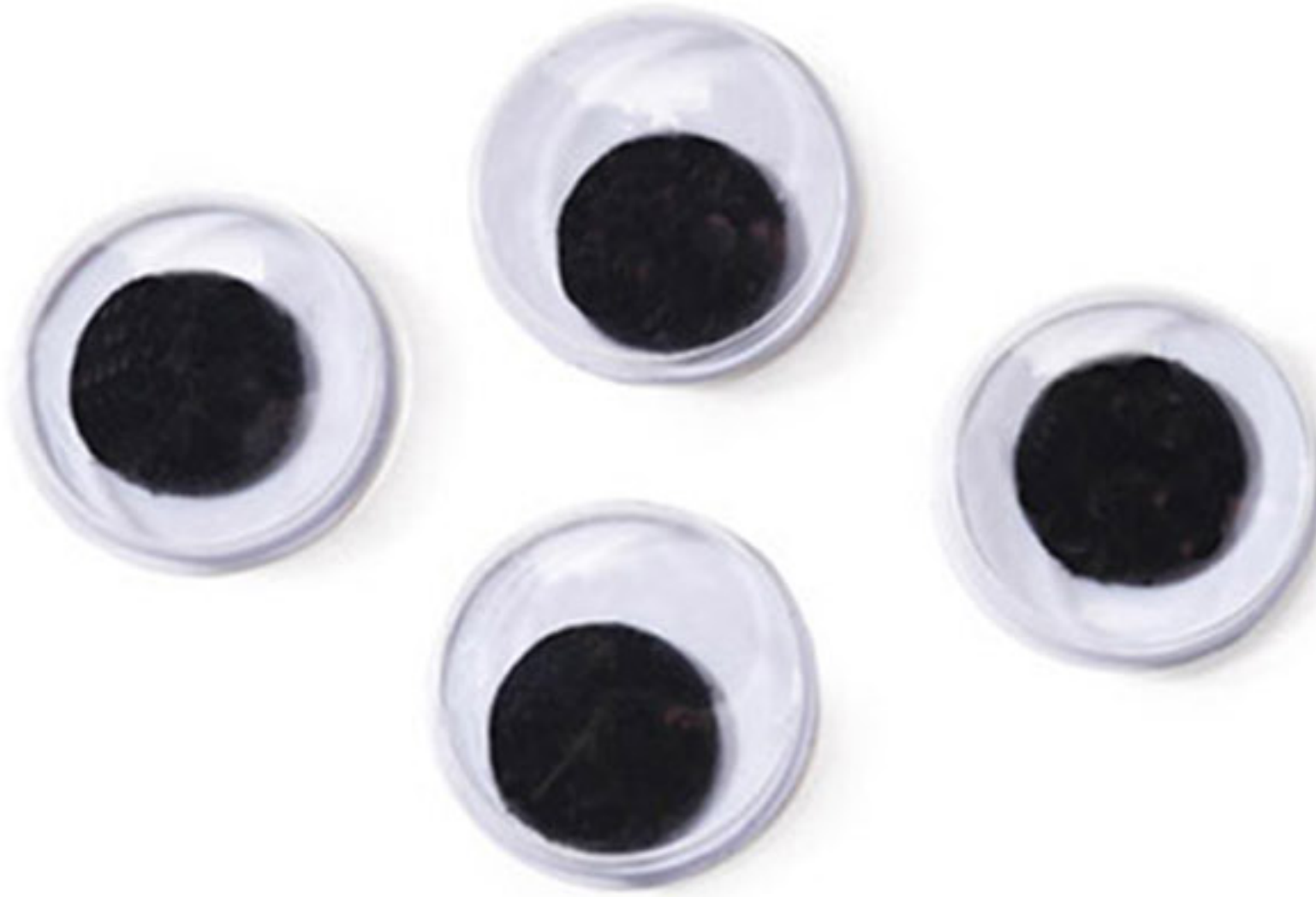
Oczka samoprzylepne (do zabawek)