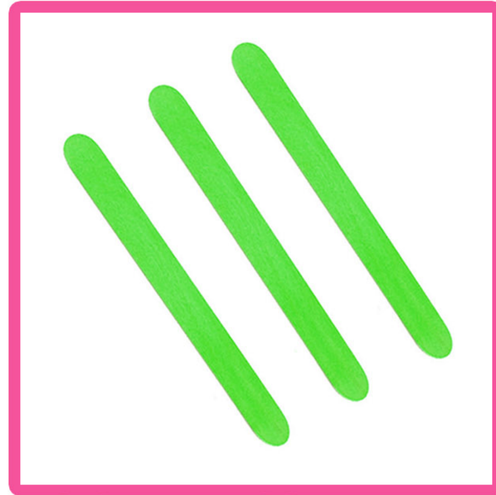
Kolorowe patyczki od lizaków (najlepiej zielone)