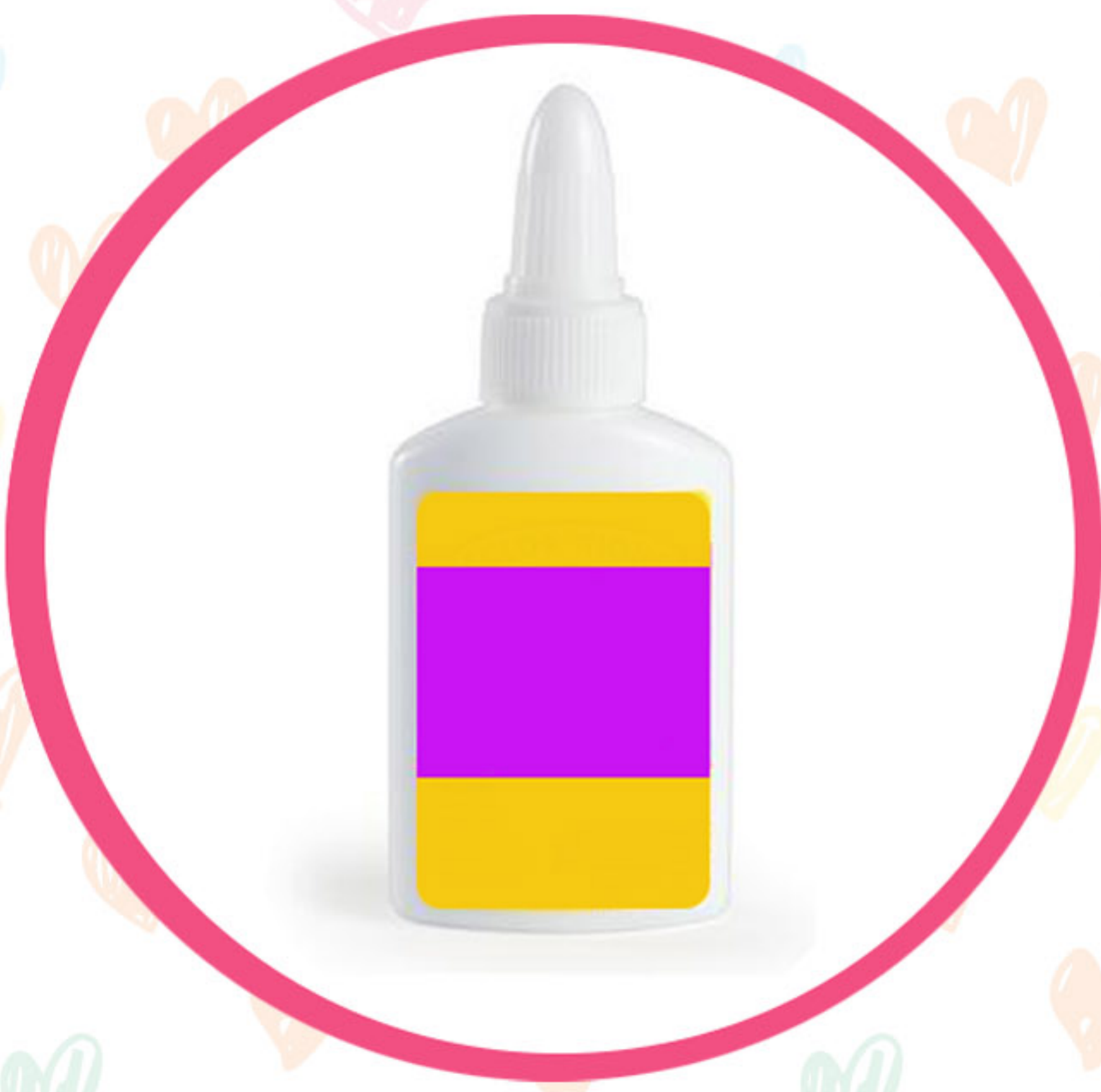
KLEJ DO FILCU