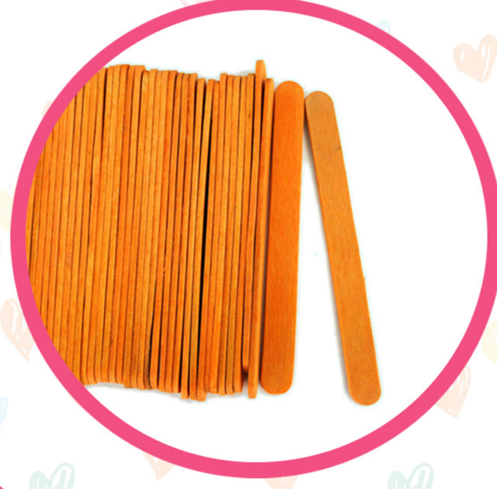
PATYCZEK OD LODA